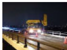
▲橋梁作業車による作業の状況