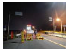
▲規制状況(イメージ)